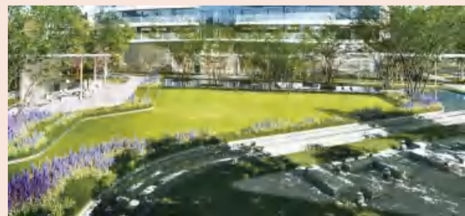
BFC 复星外滩中心效果图

秉承复星“让全球每个家庭生活幸福”使命，BFC复星外滩中心获得WELL Community金级预认证，R3 获得 WELL