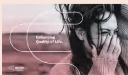
复锐医疗打造美丽生态系统

综合毛利润由2020年90.3百万美元增加76.6百万美元，达到2021年166.9百万美元。