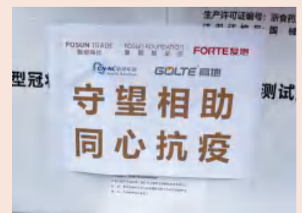
向泉州市红十字会捐赠的抗疫物资

泉州市医药公司，医疗应急物资储备管理小组表示，这批试剂根据政府需求，配送到泉州各县市区。居家不便出门的人群，尤其是老人和幼童得到很大帮助。抗原检测也是对常规核酸检测的有效补充，确保检测全覆盖，提高筛选率。