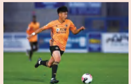
戴伟浚在英超狼队