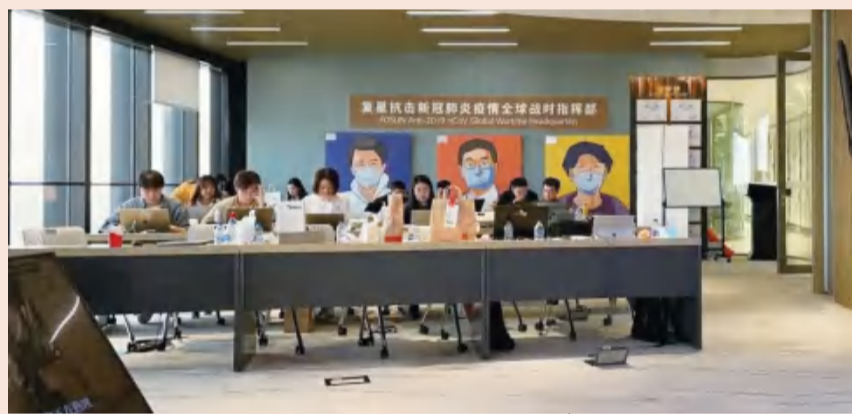
复星抗疫指挥部启动战时机制

东街道联络物资安排，听到社区主任感慨“志愿者又干了一个通宵，他们想吃碗面都难”，又为街道社区安排12箱方便面。