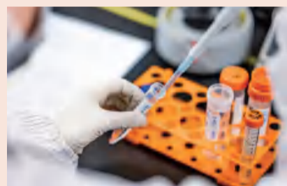
十年磨一剑，复宏汉霖在生物仿制药上不断产出创新产品

汉曲优®（曲妥珠单抗，欧洲商品名：Zercepac®）是复宏汉霖抗肿瘤领域核心药，2020年相继在欧、中获批上市，对外授权包