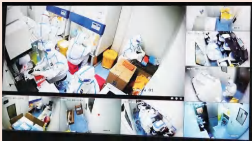
核酸检测专家在方舱紧张工作

3月13日，佛山复星禅诚医院、广州新市医院、温州老年病医院、武汉济和医院、宿迁市钟吾医院、岳阳广济医院、徐州矿务