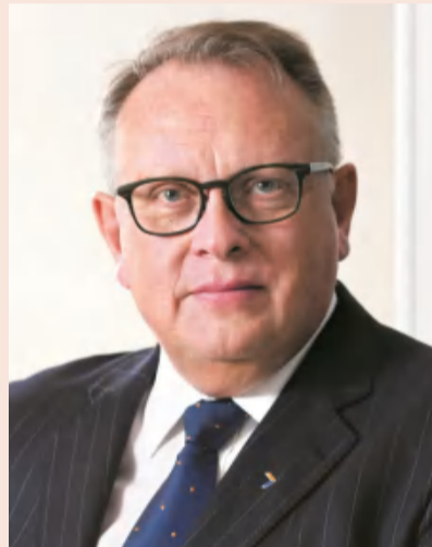
Franz Hahn (韩润南)，鼎睿联合创始人兼首席执行官

2022年12月，鼎睿再保险10周年。韩润南(Franz Hahn)，鼎睿联合创始人兼首席执行官，带领团队从不到20到超120名，覆盖18国20多种语言。事实上，再保业务之前，Franz是名律师。连续十年增长之上，他希望扩大全球化，为社会、客户和其他利益相关方创造价值。