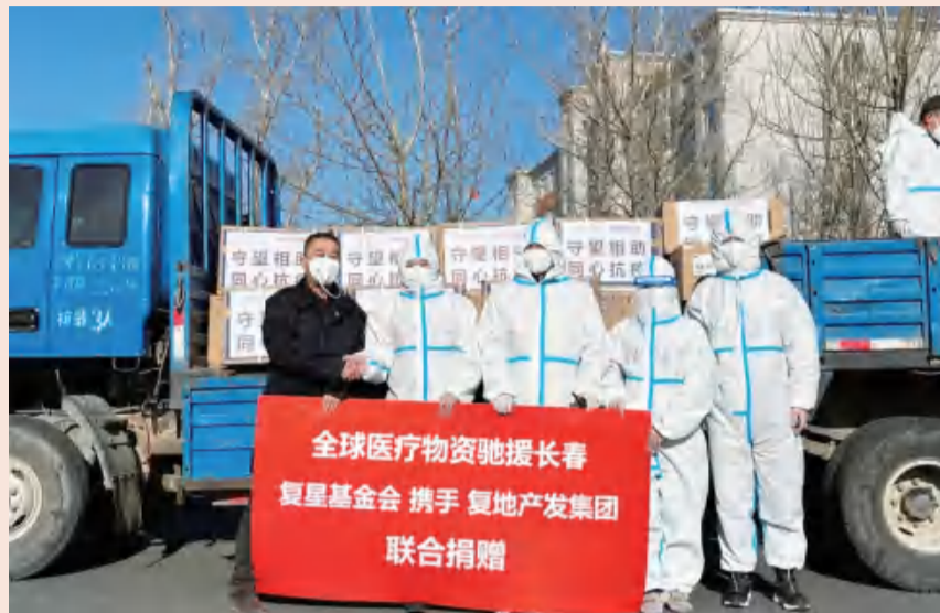
复星基金会联合复地产发驰援长春

自九台疫情出现以来，复地产发、复星基金会、舍得酒业、柏中环境、德邦证券等单位联合捐赠的首批1140件防护服、5000只N95口罩，第一时间驰援到疫情严重的九