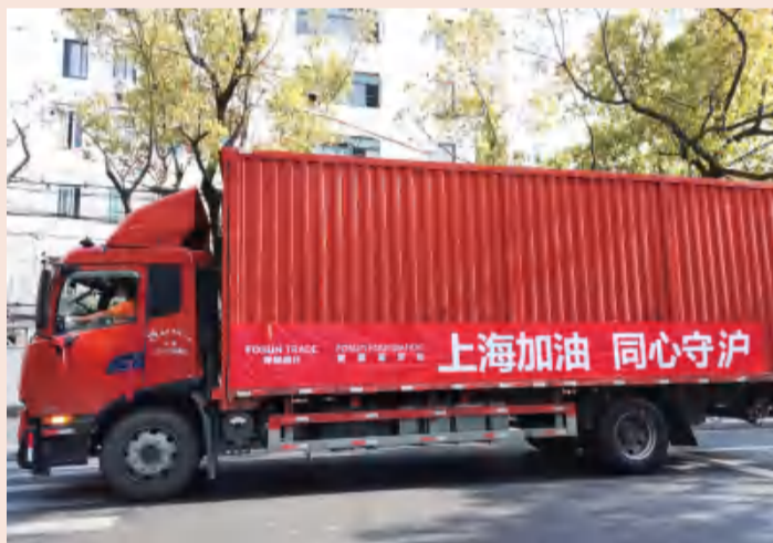
满载社区驰援物资的4.2米长卡车成上海马路上鲜亮的一抹红

截至4月8日晚，上海复星公益基金会（简称“复星基金会”）“社区驰援”行动已驰援182个社区超34万件防疫、生活物资。