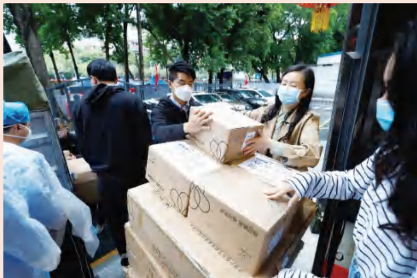
明月街道接收物资